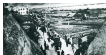
1902 考古發掘位置在九龍城填海前屬於海濱範圍，1902年該處仍有不少農業活動。

他說，今次發現反映有大量居民聚居，對本港歷史研究有重大作用。他又指過往英國一直指本港開埠前是小漁港，又只集中說新界的大家歷史，忽視本港市區數百年